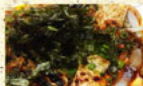
・韓国辛みそ豆腐